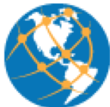
ESPACIO DE DIFUSIÓN

Es por esto que hemos dedicado la mayor parte de nuestro tiempo y esfuerzo al desarrollo de tres herramientas informáticas que consideramos pueden servir de gran ayuda para cubrir estas necesidades, así como de complemento a la actividad presencial de los círculos.