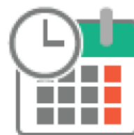
ESPACIO DE ORGANIZACIÓN

Trabajamos para garantizar la seguridad y la estabilidad de estos espacios, así como para documentar correctamente el uso de los mismos y facilitar al máximo el aprendizaje.