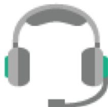
ESPACIO DE ENCUENTRO